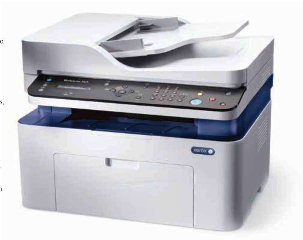
WorkCentre 3025. Copiado. Impresión. Escaneado. Fax.*

* El fax y el ADF están solo disponibles en la WorkCentre 3025NI.