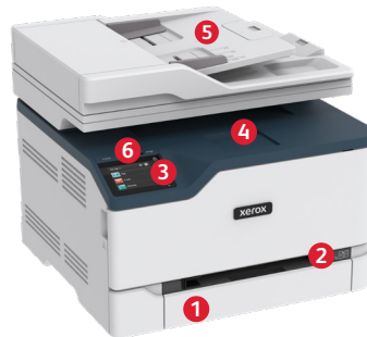
Equipo multifunción a color Xerox® C235