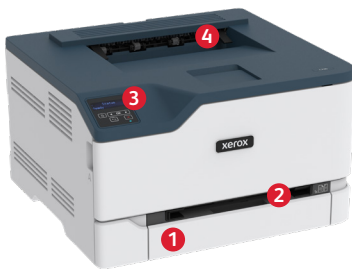
Impresora a color Xerox® C230