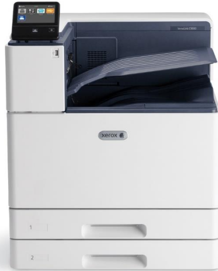
VersaLink C8000 Reemplazo de Phaser 7500

Para oficinas con necesidad de imprimir altos volúmenes de documentos A3 a color